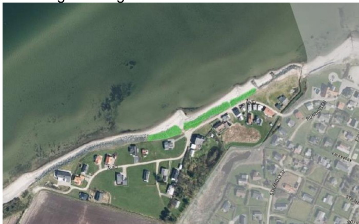
Luftfoto 2: placering af kystbeskyttelsen

Placeringen fremgår af nedenstående luftfoto.